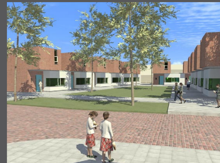
Dr. de Bruijnlaan te Hoogerheide